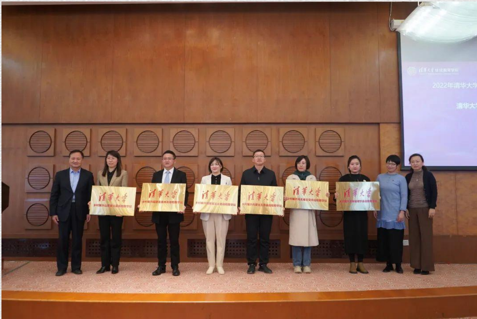
新建远程教学站授牌仪式