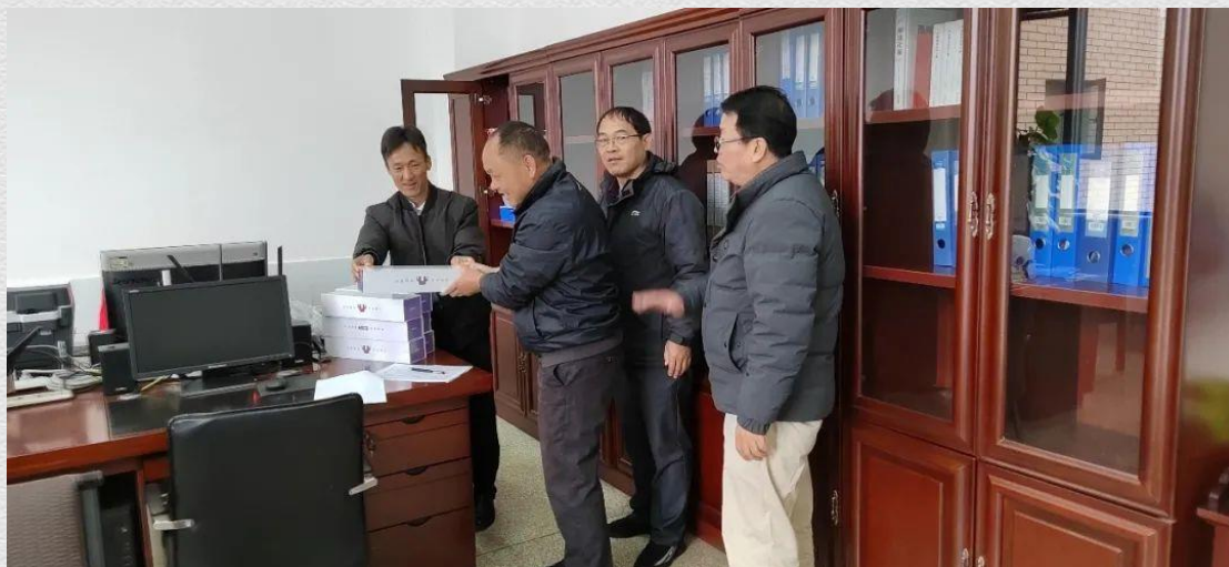
云南南涧教学站向乡村教师发放护眼灯