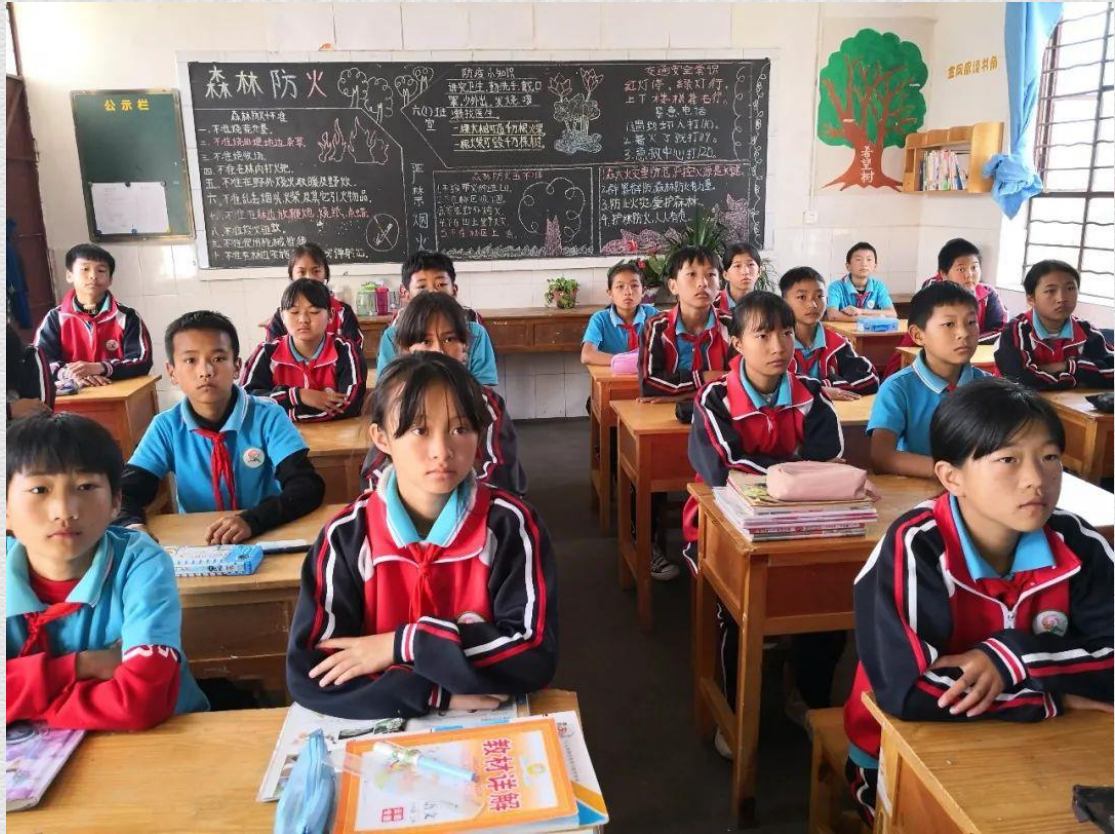
南涧凤岭小学六（1）班的学生在线学习科普讲坛课程“奇美丹霞地貌”