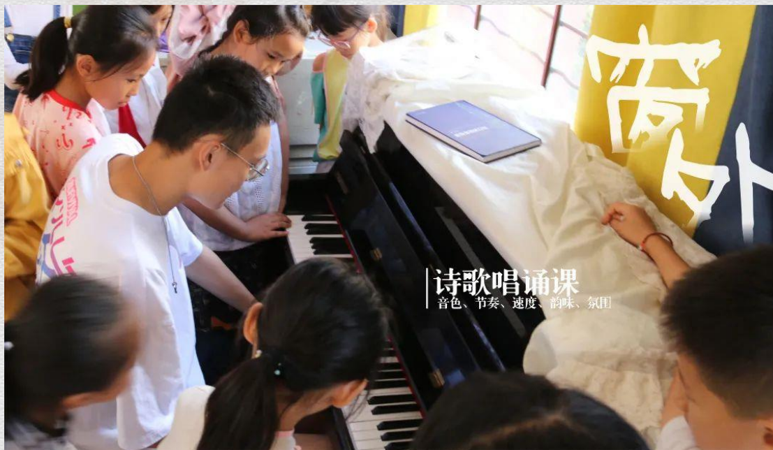
继续教育学院组织清华学生赴南涧小学开展暑期社会实践

继续教育学院连续多年组织和支持清华青年师生赴南涧开展暑期社会实践，鼓励师生参与学校定点帮扶。2021年，继续教育学院组织由学生教育扶贫公益协会和美术学院团委共同组成的“窗外——乡村美育支教实践支队”赴南涧小学开展暑期社会实践。同学们发挥学科专长，融合多学科优势，开设了丰富多彩的美育课程，以美育促进乡村教育振兴。清华师生开展暑期实践的同时，也深刻体会到南涧脱贫攻坚取得的成就，接受教育，增长才干。