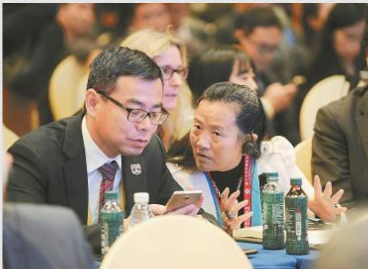
参会嘉宾就如何将科技创新和教育相融合展开交流。

当教育遇见科技，两者将碰撞出怎样的火花？科技与教育融合发展，还有哪些问题需要解决？