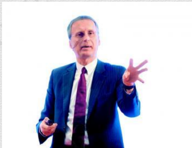
《大数据时代》作者、牛津大学教授维克托·迈尔·舍恩伯格在亚洲教育论坛年会上