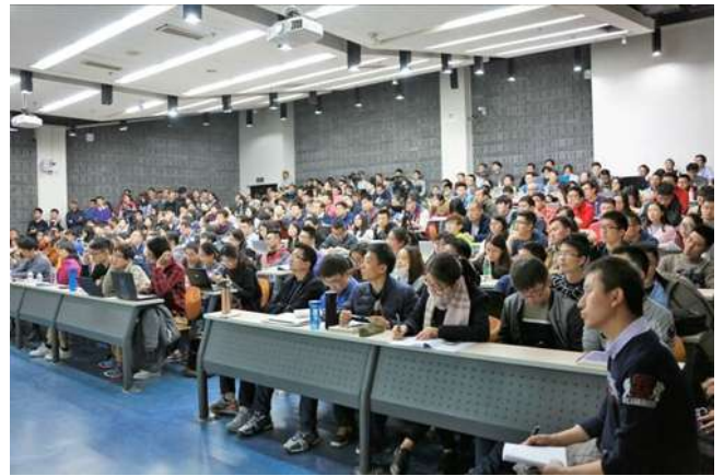
认真听讲座的同学们

近年来，中国经济的 GDP 增长率连续 5 年低于 8%，2016 年 GDP 增长率为 6.7%，是 1991 年以来首次低于 7%，并且 GDP 增长率还在继续下滑。海闻教授解释了当前经济增长放慢的原因，首先，中国经济从高速发展阶段进入并将长期处于中高速发展阶段，同时处于宏观经济周期的短期波动时期，并且正经历着“中等收入陷阱”的特殊阶段。所谓“中等收入陷阱”是指当一个国家的人均收入达到中等水平后，缺乏经济增长动力，既无法在工资方面与低收入国家竞争，又无法在尖端技术研制方面与富裕国家竞争，最终出现经济停滞的一种状态。海闻教授认为陷入“中等收入陷阱”的主要原因是产业结构调整滞后和教育科研滞后。面对当前中国的经济状况，海闻教授认为未来中国经济会有超过 7% 的增长，中国经济仍处于工业化和城镇化的起飞阶段，仍有较大的改革空间。总体而言，中国经济不会“硬着陆”，正在企稳向好。