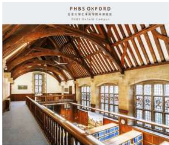
汇丰商学院牛津校区实景

英国教育领域的开放政策为北大汇丰商学院牛津校区的诞生提供了可能，也造就了当地全球竞争下的优质高等教育。目前，包括海外投资机构在内，已有近 110 家高教机构在英国高教领域竞争全球生源。面对高度开放、高度国际化、高度竞争的英国高教市场，北大汇丰商学院已经制定了完整的规划，决心将“北大”和“北大汇丰”的品牌提升到新的高度。