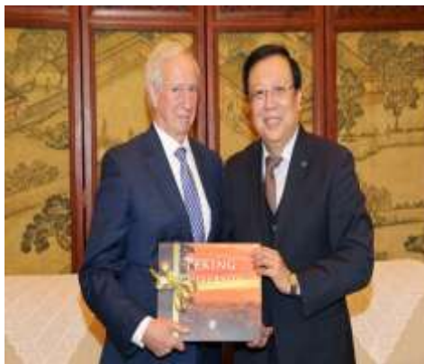
郝平向布罗德海德校长赠送纪念品

郝平首先高度赞扬了杜克大学在创建昆山杜克大学过程中所付出的努力。他表示，杜克大学是世界知名学府，很多学科在全球领先，昆山杜克大学则是中外合作办学的成功范例。北京大学目前正在努力推进“双一流”的建设工作，此次杜克大学代表团的来访，将促进北大与杜克大学及昆山杜克大学的合作，推动北大“双一流”建设和高等教育改革。布罗德海德校长随后回顾了昆山杜克大学创建的历史，并展望未来，希望郝平能够继续支持昆山杜克大学的发展。