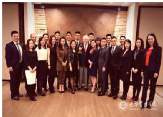
光华管理学院学生与巴菲特合影

此次的 20 名学生代表是光华管理学院从各个项目的近百名申请者中甄选出的优秀者。教师代表和学生代表组成的筛选委员会审阅申请材料，综合考虑了学生的成绩、金融课表现、工作背景以及英文水平等，并严格面试，最终挑选出了和巴菲特先生见面的幸运儿。