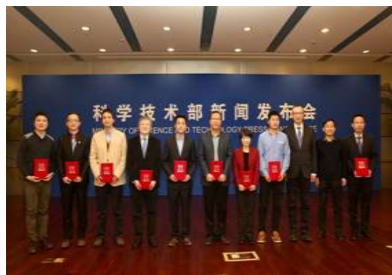
所有获奖人员合影

法；揭示 RNA 剪接的关键分子机制；发现精子 RNA 可作为记忆载体将获得性性状跨代遗传；构建出世界上首个非人灵长类自闭症模型；揭示胚胎发育过程中关键信号通路的表观遗传调控机理。