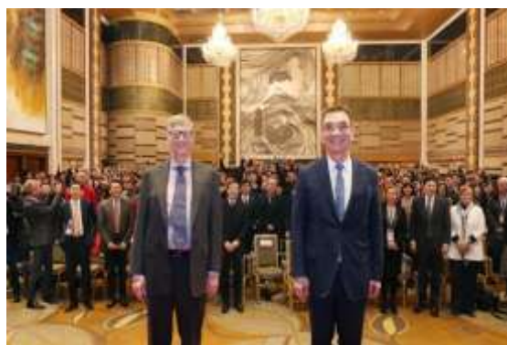
盖茨和林毅夫与现场师生合影留念