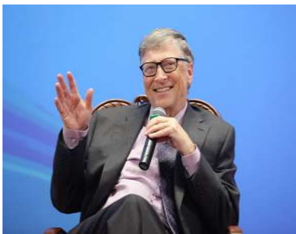
盖茨回答学生提问

演讲结束后，盖茨回答了现场学生提问，对“如何在新时期实现联合国可持续发展目标”“怎样劝说更多普通人投身慈善事业”和“投身慈善事业的时机”等问题深入解答。