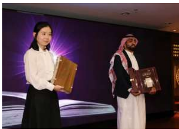
中沙两国学生代表向分馆