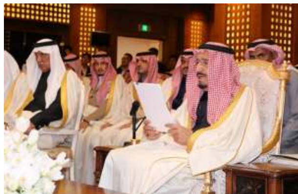
萨勒曼国王陛下致辞

史性访华所取得的各项成绩的标志，体现了国王陛下对促进世界和平、两国友好的美好愿望。之后，林建华向国王陛下颁发了北京大学名誉博士学位证书。萨勒曼国王陛下表示，北京大学是中国传播文化知识的中心，也即将迎来 120 周年校庆，很高兴接受北京大学名誉博士学位称号，并希望北京大学分馆成为沙中两国的文化见证，为两国开拓更广阔的合作前景作出贡献。最后，阿卜杜阿齐同学和孔雀同学分别代表沙中双向阿卜杜勒·阿齐兹国王公共图书馆北京大学分馆赠送两国珍贵的书籍。