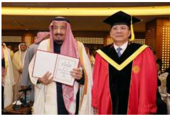
林建华向萨勒曼国王陛下颁发北京大学名誉博士学位证书

阿卜杜勒·阿齐兹国王公共图书馆在全世界设有三个分馆，分别位于利雅得、卡萨布兰卡、北京大学。北大分馆项目得到了两国领导人的高度重视。作为人类文明最重要的载体之一，图书馆是文明萃取的精华，代表着一个民族和国家的精神高度。沙特国王图书馆北大分馆的建成不仅为中国读者提供丰富的阿拉伯图书资料，促进北京大学及其他高校的阿拉伯语教学和中东研究，更将成为两国民间文化交流的纽带与桥梁，